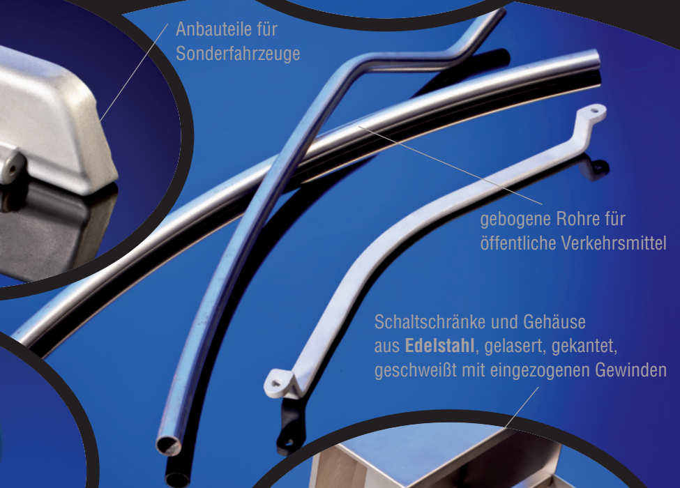
gebogene Rohre für öffentliche Verkehrsmittel