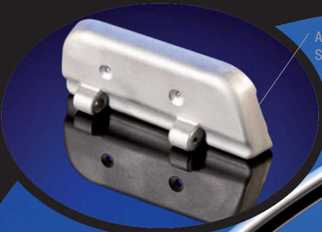
Anbauteile für Sonderfahrzeuge