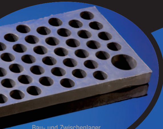
Bau- und Zwischenlager für die Schienentechnik